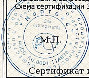
Схема сертификации З.

Маркировка продукции знаком соответствия производится по ГОСТ Р 50460-92. Место нанесения знака соответствия на упаковке и в сопроводительной документации.